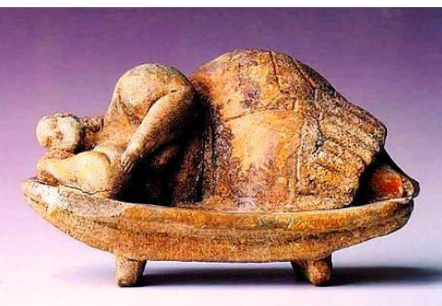
Dea dormiente, 3300-2500 a.C., Malta.

L’invito a queste serate è necessariamente rivolto a donne e uomini, perché è l’incontro con queste due differenze che rende possibile il benessere individuale e la trasformazione sociale, per poterci dire che il futuro non è donna: è femminile.